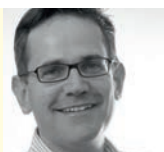
John Allison London Opera, Telegraph