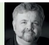
David Shengold New York Opera News, Time Out N. Y.