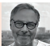
Holger Noltze Köln Opernwelt, DLF, WDR, takt1