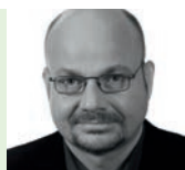
Claus Ambrosius Koblenz Rhein-Zeitung