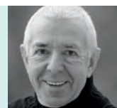
Alexej Parin Moskau Verlag «Agraf»