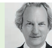
Christian Berzins Zürich Zeitungen der CH Media